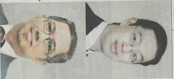
Penyarah Sekolah Penaigaan Siswazah Arshad Ayub, Universiti Teknologi MARA (UTM)